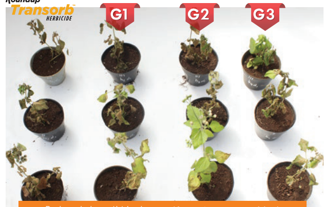
Babadotan / Wedusan ( Ageratum conyzoides ) dosis 1,5 l/ha 7 HSA