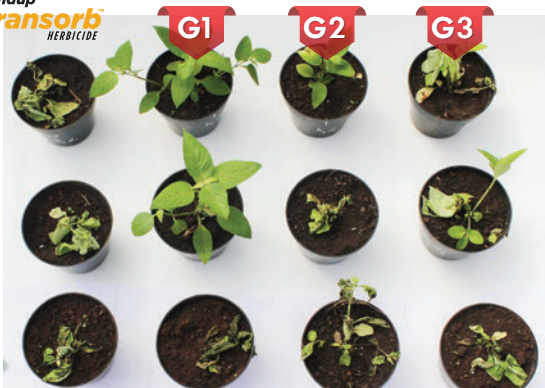
Assystasia intrusa dosis 1,5 l/ha 7 HSA